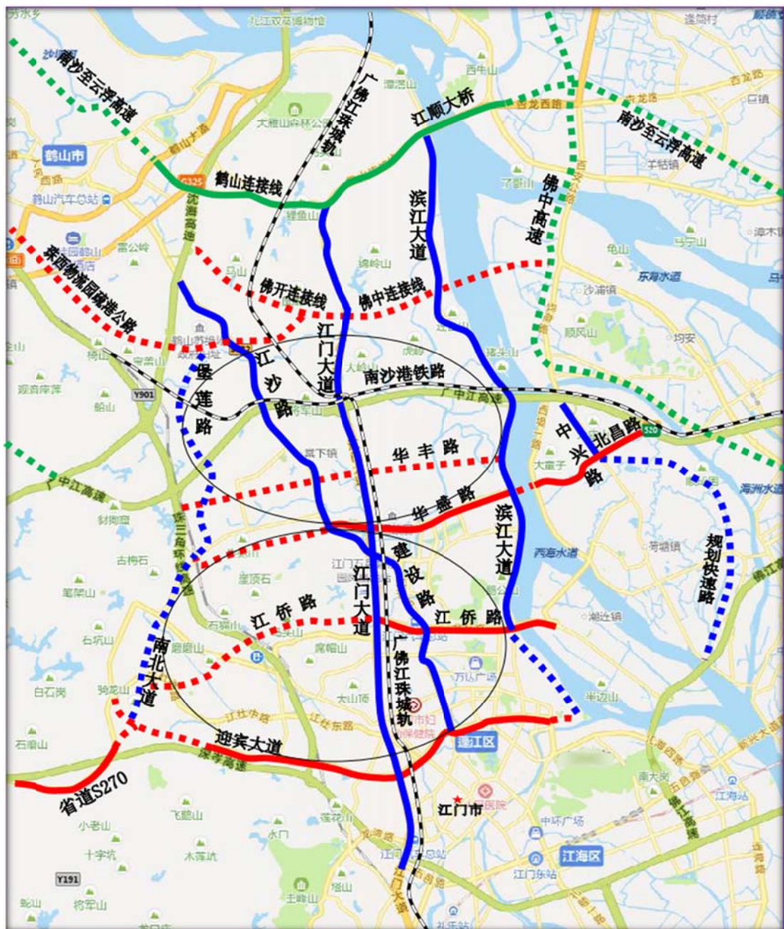
蓬江区“五横五纵两环”道路示意图

连接南北、贯通东西的轨道交通网络。积极配合江门市与广州、佛山、中山、珠海轨道交通合作，融入城际铁路、市域（郊）铁路发展，推动区域轨道交通一体化建设；配合建设珠江肇高铁和启动城市轨道交通1号线、2号线一期等相关铁路工程。